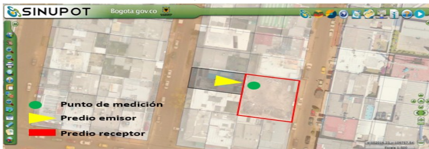
Figura 1. Ubicación del predio emisor, receptor (CR 45 A No. 95 - 37) y punto de medición.

Nota 4: Datos suministrados en el Anexo No 5. Reporte SINUPOT.